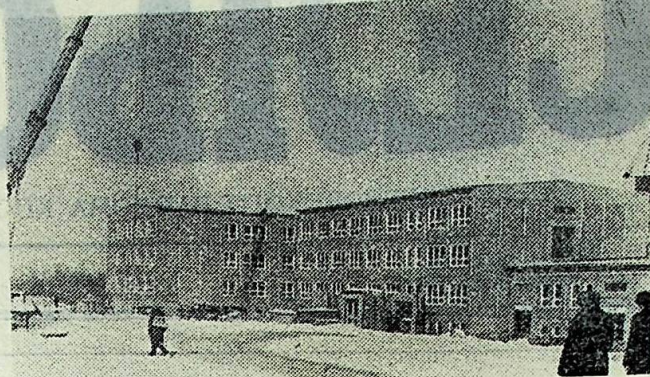
Уже выстроены три корпуса новой школы, ввод ее в строй действующих планируется к началу нового учеб- ного года.

Советские специалисты, а также их кол- леги из стран — членов СЭВ, приступив в 1986 году к созданию «Прогресса», до- срочно выполнили задания 1986—1987 годов. В сложных природных условиях работают посланцы из ГДР в Пермской области.