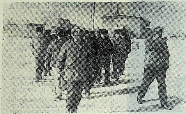
Во время встречи председателей колхозов и секретарей партийных организаций со строителями из ГДР. Участники знакомятся с объектами новостроек.