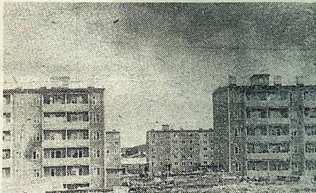
Новый микрорайон в Березовке