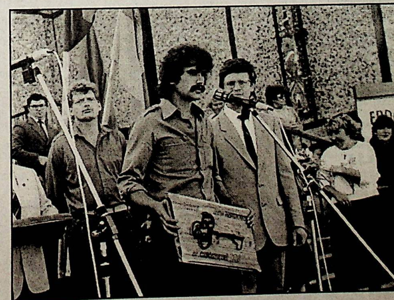
Открытие школы. 1988 г.