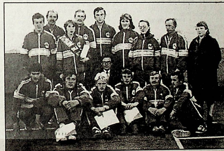
Спортивная команда ЛПУмг - призер летней спартакиады «Пермтрансгаза» 1986 года в Горнозаводске.