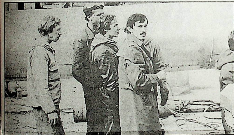
Огневые работы на КС-4. 1986 г.